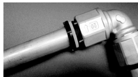
②標線が消えるまでパイプを挿入