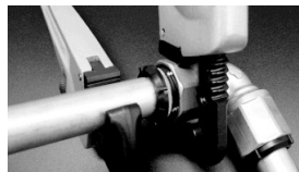
③パイプを押さえ、袋ナットを締込む