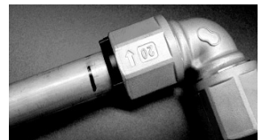
④インジケーターが消えれば完了