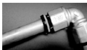
②標線が消えるまでパイプを挿入