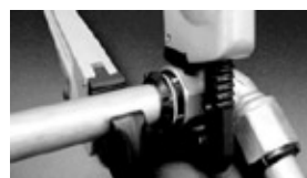
③パイプを押さえ、袋ナットを締込む