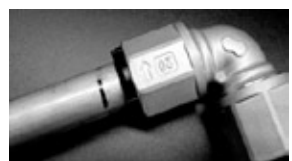
④インジケーターが消えれば完了