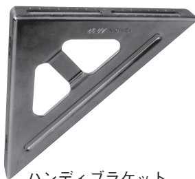
ハンディブラケット