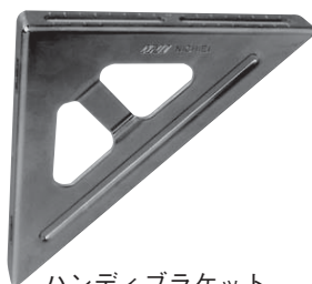
ハンディブラケット