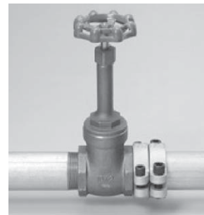
鋼管マルチ継手型