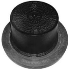
下水道協会認定品 [JSWS G-3-2005]